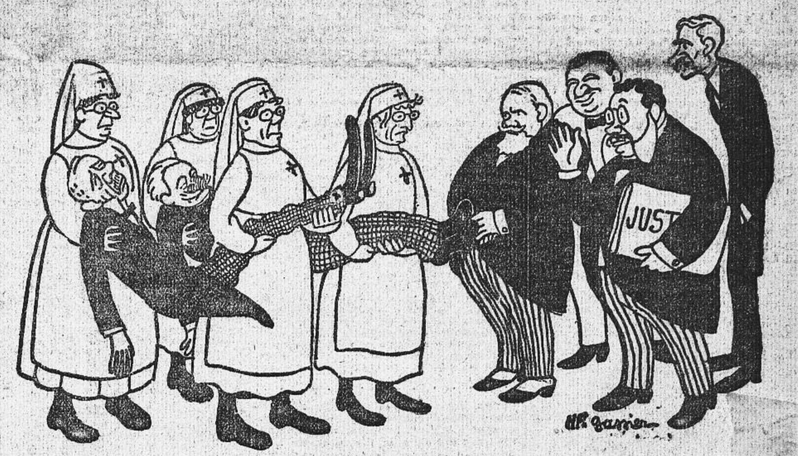
L'ARRIVÉE CHEZ LES ARAGONS -- Sauvés! Ah, il ne faudrait pas beaucoup de victoires comme ça pour être foutus!

La discussion est reprise à la Chambre sur la politique extérieure et le débat nouveau ressemble à tous ceux qui le précèdent.