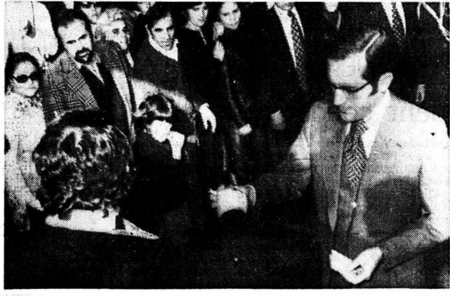
Le général Eanes, président de la République, votant lors des élections municipales de décembre 1976.

de francs suisses) tandis que le Fonds monétaire international a accordé 50 millions de dollars (environ 110 millions de francs suisses) seulement aux autorités monétaires portugaises. Le commentateur indique que «c'est une misérable récompense pour les réalisateurs portugais qui ont consisté tout d'abord à extirper la dictature du pays puis à édifier un régime parlementaire sur le désordre révolutionnaire».